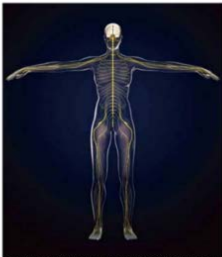
神経にどのような刺激を与えたらよいのかその刺激の源がSPAOREの開発でした