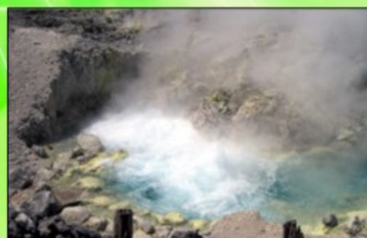
玉川温泉の湯治場には毎年多くの方がホルミシス効果を求め、訪れています。