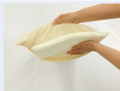
お好みに応じて隙間に入れて お使い下さい。