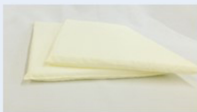
高さ調節用マット 2枚付き